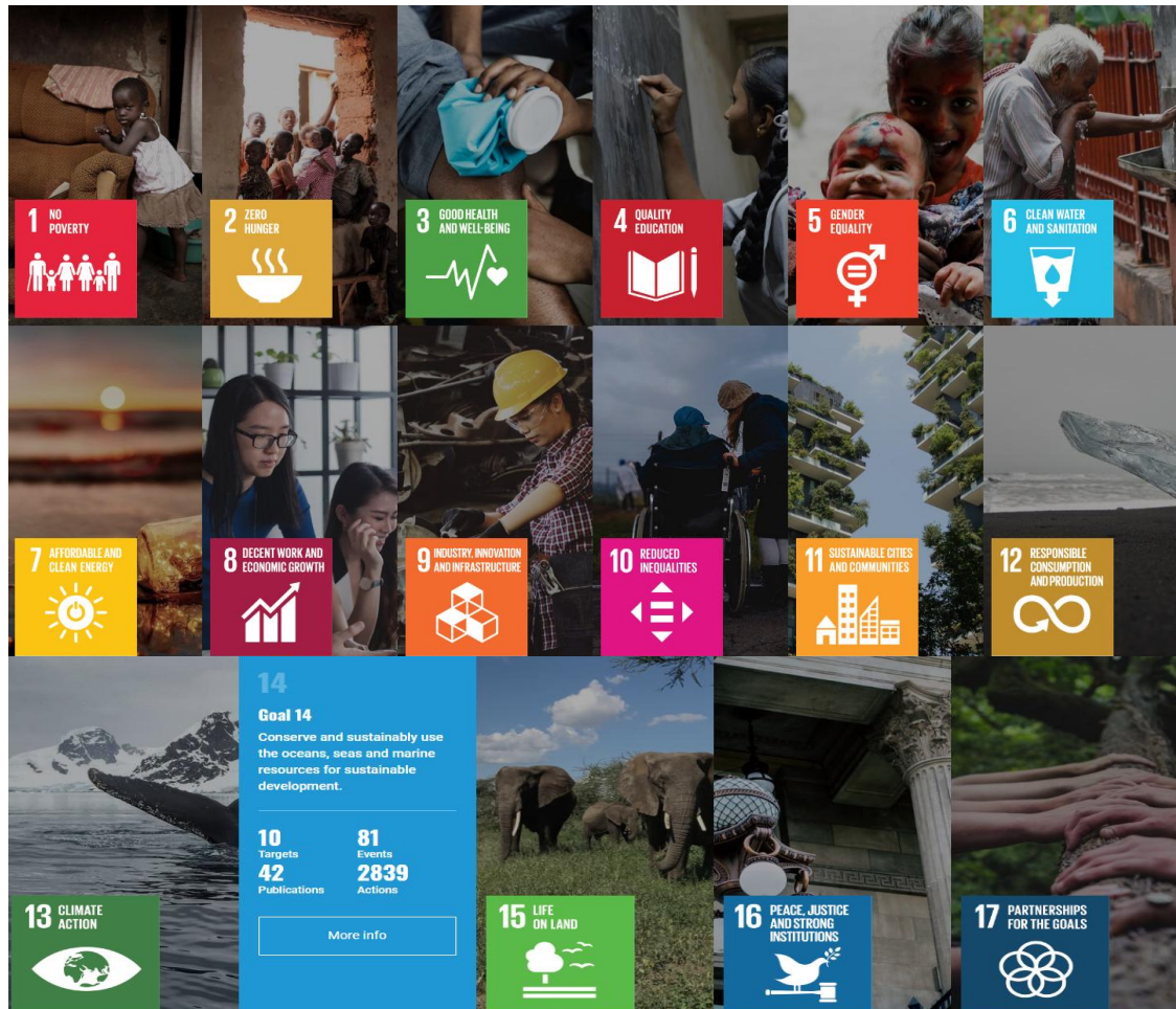
Οι 17 Στόχοι Βιωσιμότητας των Ηνωμένων Εθνών ( https://sdgs.un.org/publications )

Κάτω από τις πιέσεις των κλιματικών συνθηκών και της αυξανόμενης ανισότητας στην πρόσβαση σε υγιεινή τροφή, καθαρό νερό, ενέργεια, υγειονομική περιθαλψη και άλλων βασικών αγαθών και δικαιωμάτων των ανθρώπων, ο ρόλος της εκπαίδευσης, σε κάθε της βαθμίδα, αναγνωρίζεται ως κομβικός, καθώς ενδυναμώνει τους πολίτες με κριτική ικανότητα, τους εξασφαλίζει πρόσβαση στην τεκμηρίωση και άμυνα στην παραπληροφόρηση και κάθε μορφής εκμετάλλευση.