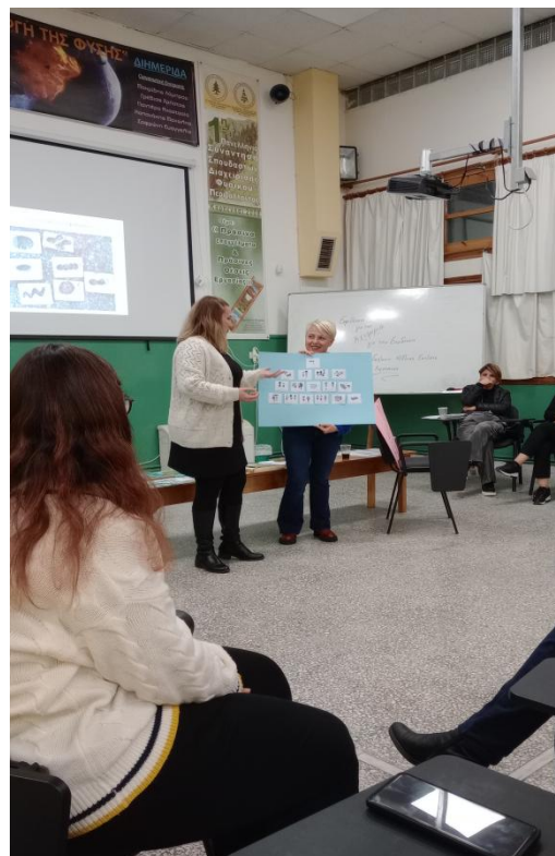
Οι ομάδες εργασίας παρουσιάζουν στην ολομέλεια τις Πυραμίδες Αξιών που συνέθεσαν.

Το Τμήμα Δασολογίας έθεσε στη διάθεση των εκπαιδευτικών του Νομού Ευρυτανίας συγκεκριμένες προτάσεις για αξιοποίηση, στο χρονοδιάγραμμα κάθε σχολικής και ακαδημαϊκής χρονιάς, στο πλαίσιο ενός δυναμικού δικτύου συνεργασιών, που συνοψίζονται σε δύο βασικές θεματικές: