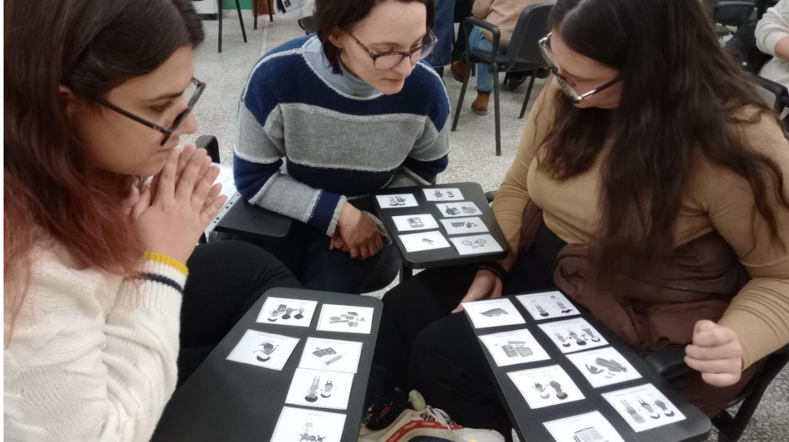
Βιωματική συμμετοχική επιμόρφωση και ενδυνάμωση εκπαιδευτικών και φοιτητών Δασολογίας στην κατεύθυνση της εκπαίδευσης για την αειφορία.

Το Τμήμα Δασολογίας και Διαχείρισης Φυσικού Περιβάλλοντος, συγχαίρει το Σύλλογο Εκπαιδευτικών Πρωτοβάθμιας Εκπαίδευσης και το Διοικητικό του Συμβούλιο για την πρωτοβουλία της διοργάνωσης και δηλώνει την προθυμία του να υποστηρίξει κάθε εκπαιδευτική προσπάθεια, στην κατεύθυνση της αειφορίας στην εκπαίδευση της νέας γενιάς μαθητών και εκπαιδευτικών!